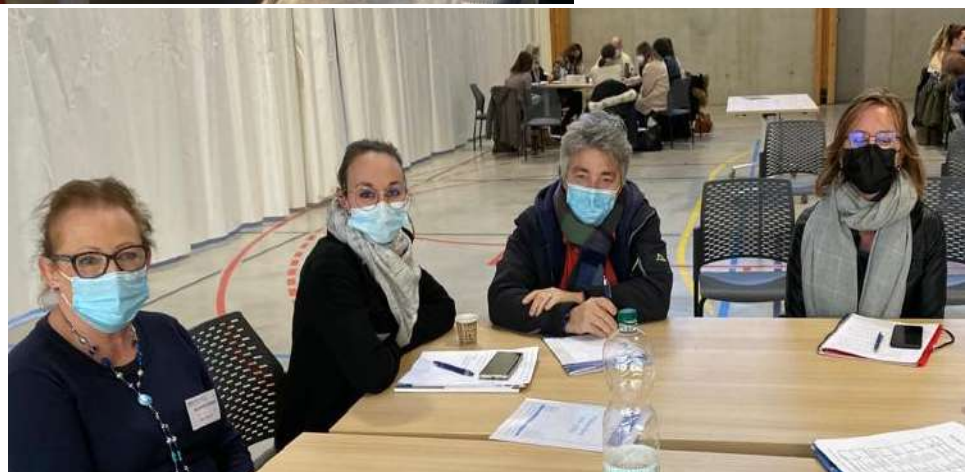
Un désir de renouveler cette journée l'an prochain.