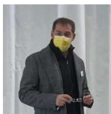
Des témoignages d'équipes