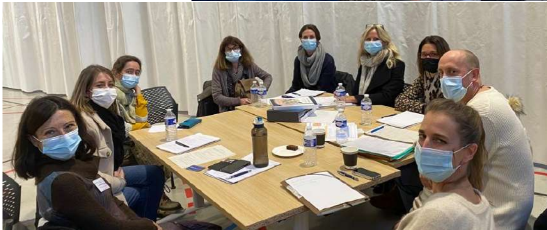
Des échanges de pratiques