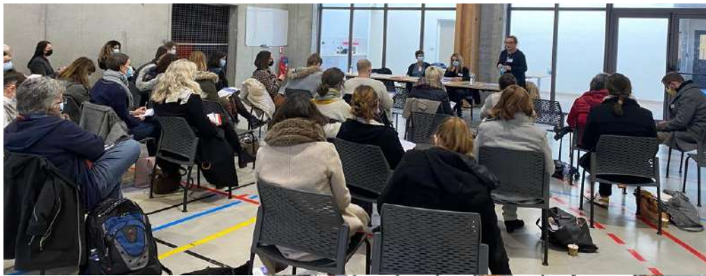
Des retours d'expériences après les forma- tions en EMS